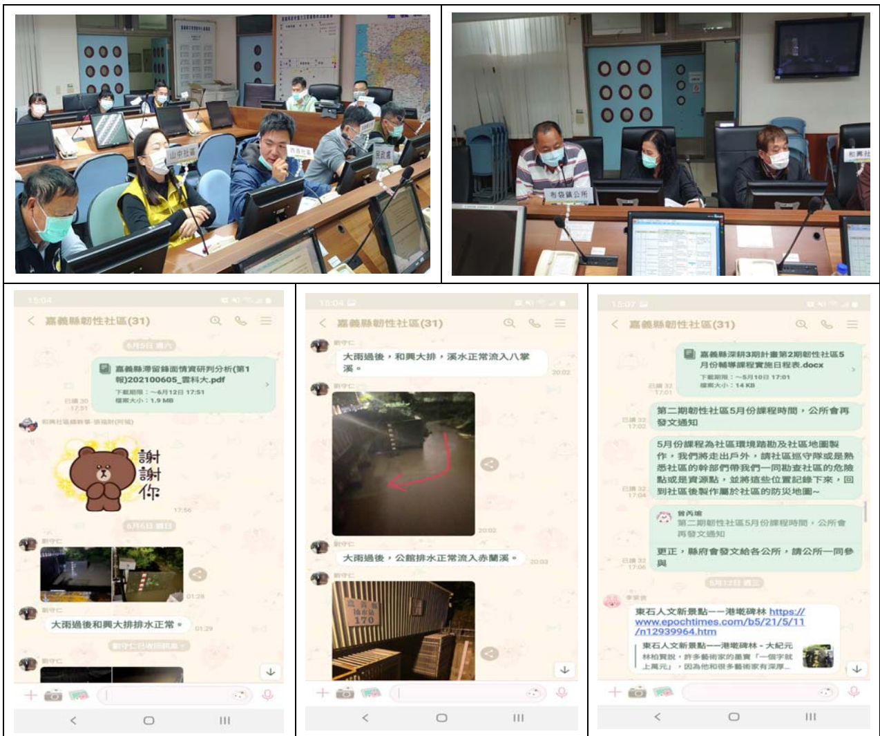
圖 7-1 韌性社區工作會議及 Line 群組

嘉義縣災害防救深耕第三期計畫於 109 年遴選第 2 期韌性社區(中埔鄉和興社區、民雄山中社區、布袋鎮中安社區)，並於 109 年 12 月 24 日辦理韌性社區工作會議，邀請縣府及公所推動小組、第 1 期及第 2 期韌性社區共同參與，提案說明社區課程規劃狀況及協助配合事項，並成立「嘉義縣韌性社區 Line 群組」，傳遞課程資訊及災害情資，如圖 7-1 所示。