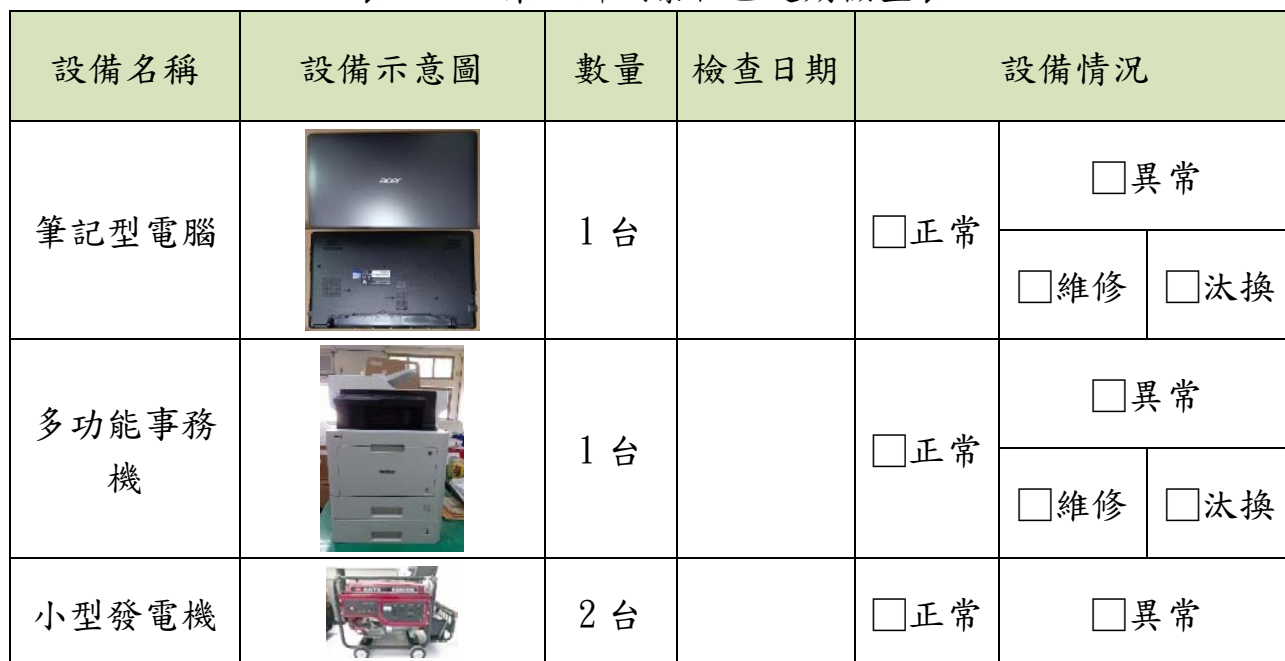
表 4-3-1 東石鄉網寮社區定期檢查表

另本社區將現有儲備物資登記造冊，並訂定物資管理機制，以利完善管理與維護社區資源，如表 4-3-1 所示。