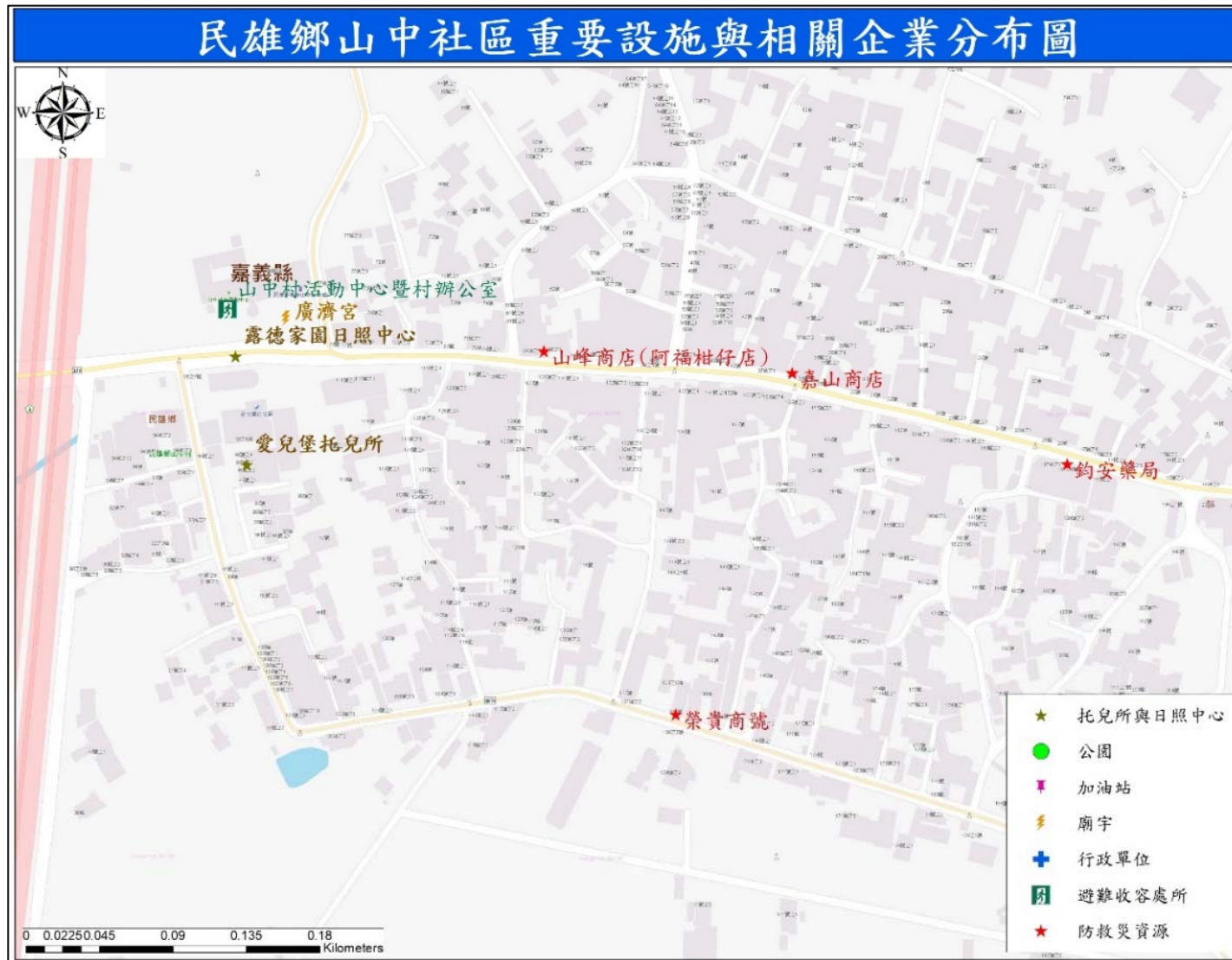
圖 4-1 山中村公共設施分布圖