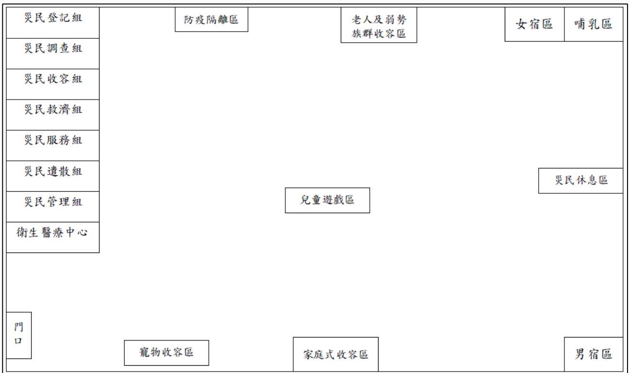
圖 4-4 和興國小-圖書館收容空間規劃圖