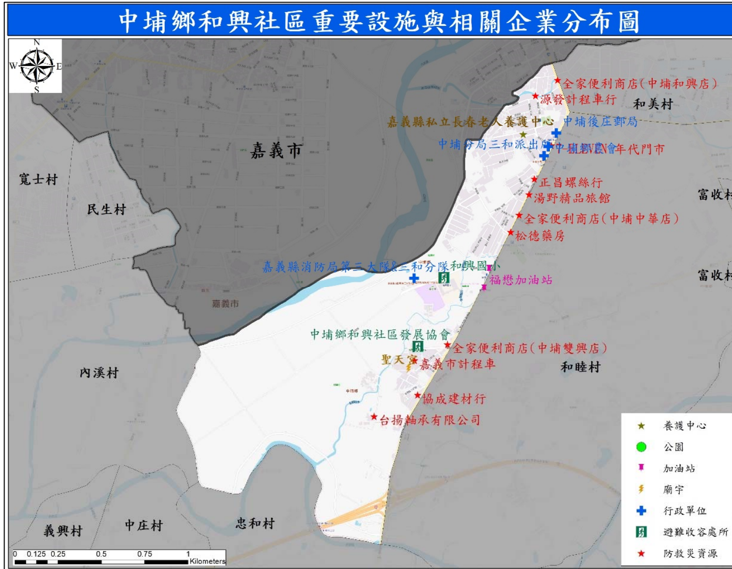
圖 4-1 和興村公共設施分布圖