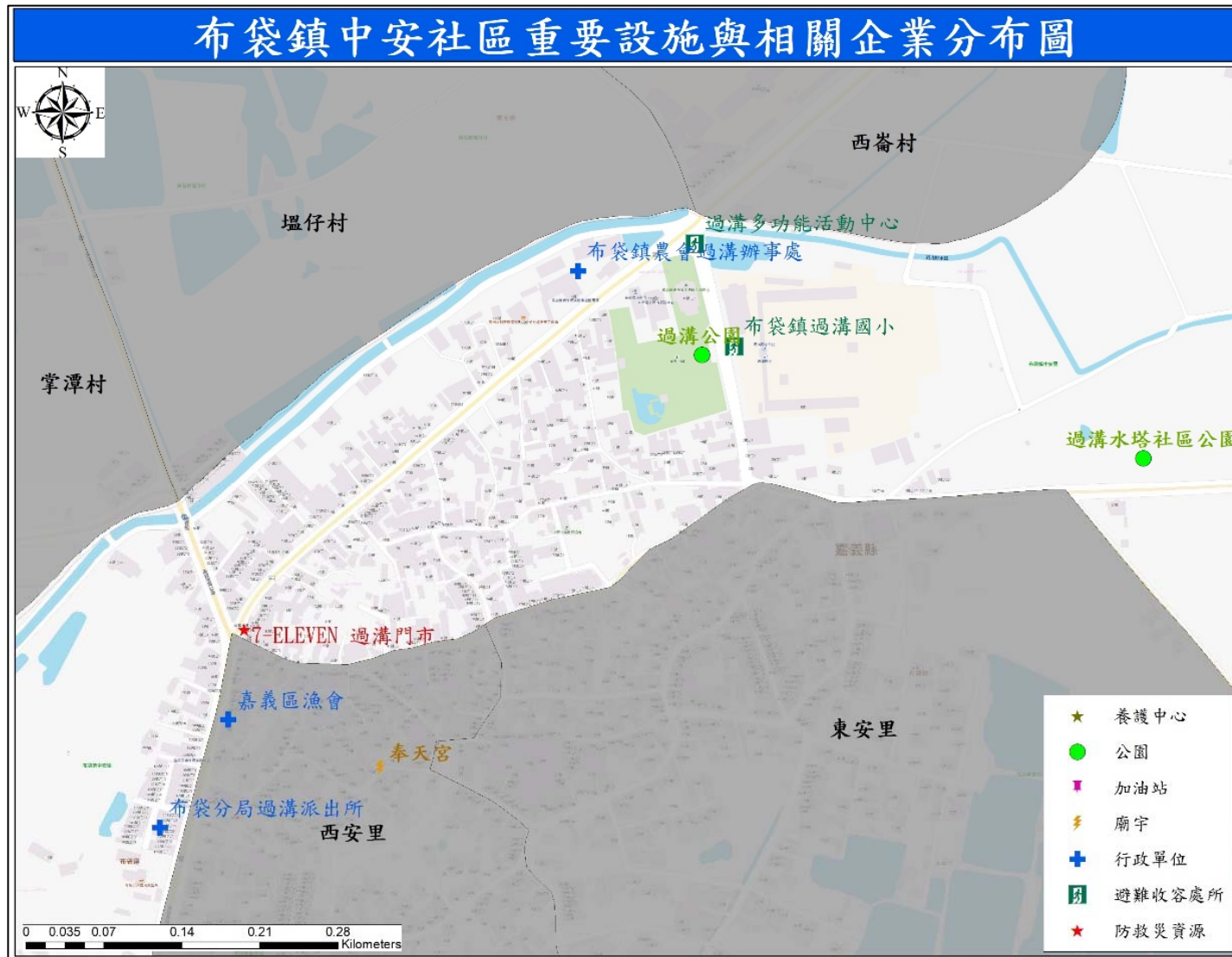
圖 4-1 中安村公共設施分布圖