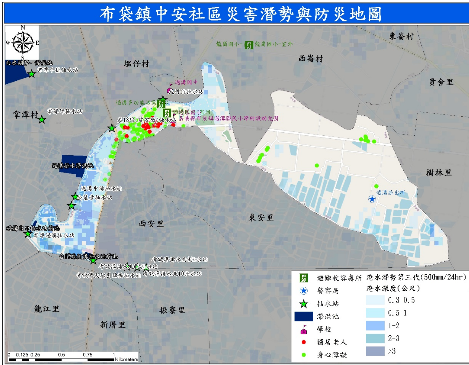
圖 2-6 嘉義縣布袋鎮中安社區 500mm/24hr 淹水潛勢圖